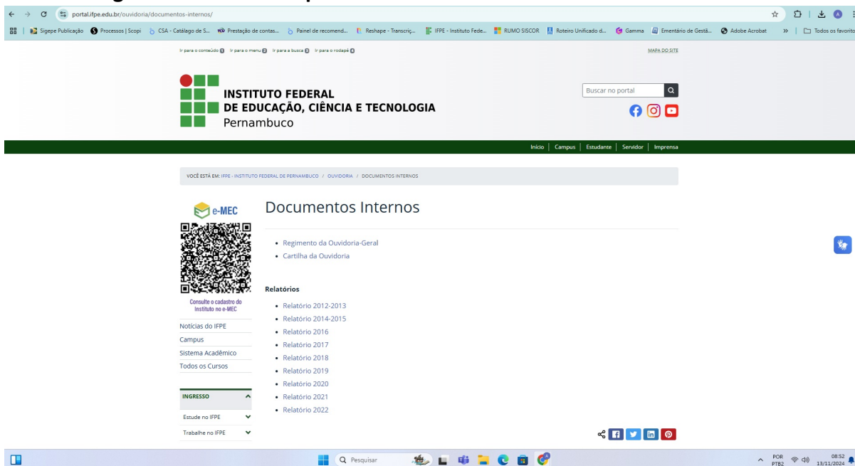
Figura 2 - Consulta ao portal dos documentos da Ouvidoria do IFPE