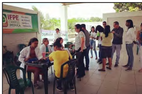
Campanha de vacinação no Campus Ipojuca (set/2018)

A Prefeitura também cooperou com o envio de máquinas e tratores para os trabalhos de terraplanagem da área onde será construído o Centro de Treinamento de Segurança do Trabalho.