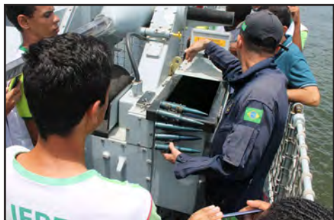
Visita técnica ao navio-patrolha Araguari (novembro/2018)

No ano de 2018, as turmas do Campus Ipojuca participaram de 36 visitas técnicas , duas delas interestaduais. As visitas técnicas possibilitam ao estudante conhecer in loco os processos produtivos de empresas e instituições ligadas a seu campo de estudo.