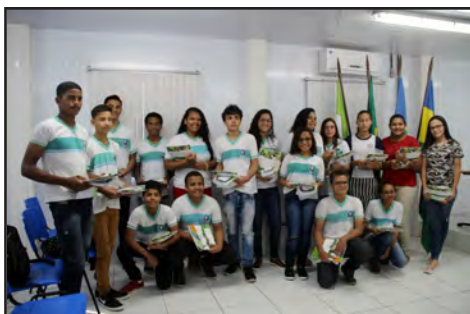
Recepção aos estudantes do curso de Robótica para o Ensino Fundamental (julho/2018)