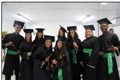
Solenidade de formatura (julho/2018)

Um total de 119 certificados de conclusão/diplomas foi emitido pelo Campus Ipojuca em 2018, tanto dos cursos técnicos quanto da graduação. Duas solenidades de formatura, no primeiro e segundo semestres, encerraram o ciclo das turmas após a conclusão dos créditos acadêmicos.