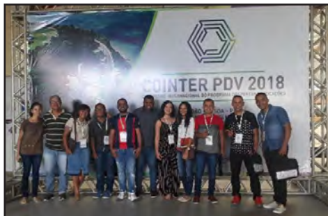
Licenciandos do Campus no Cointer, em João Pessoa (PB) (dez/2019)

Em 2018, estudantes e pesquisadores levaram trabalhos desenvolvidos no Campus Ipojuca a pelo menos dez eventos científicos regionais, nacionais e internacionais. A maior parte dos trabalhos é dos estudantes de Licenciatura em Química, cujas atividades de iniciação científica, extensão e estágio-docência possibilitaram diversas apresentações.