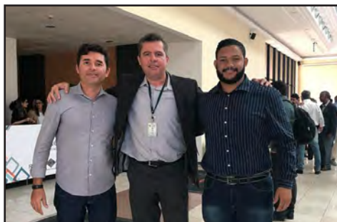
Conselheiros de Ipojuca na posse do Consup (set/2018)

O Sistema de Solicitação de Transporte e Diárias (SISTD) permite o agendamento de transporte institucional ou solicitação de diária para desempenho de função fora da região metropolitana.