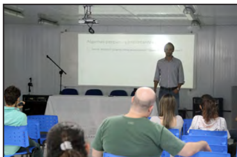
Palestra sobre Educação Financeira (nov/2018)