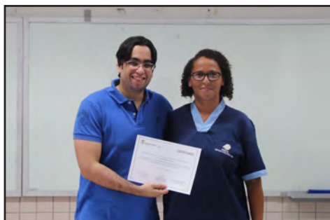
Entrega de certificados do curso de extensão em Informática (abril/2018)

No primeiro semestre, encerrou-se o curso de extensão em Informática Básica , demanda dos funcionários terceirizados do Campus . A experiência com a oferta de cursos livres começou, em 2017, com treinamentos sobre segurança do trabalho para os funcionários terceirizados.