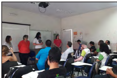
Reunião da Arinter com estudantes (novembro/2018)