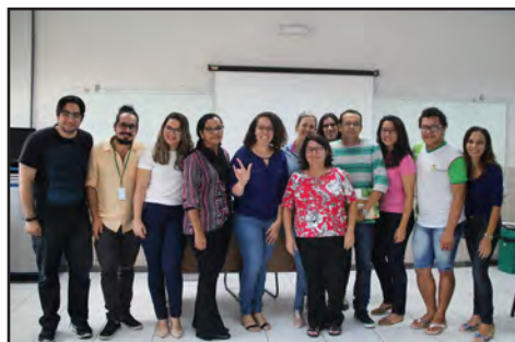
Oficina para inclusão de estudantes surdos (abril/2018)