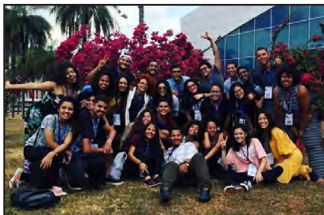
NAC no Conecta IF (ago/2018)

Um espetáculo montado pelo Núcleo de Arte e Cultura do Campus foi selecionado para a programação do Encontro Nacional de Educação Profissional, Científica e Tecnológica – o Conecta IF, que aconteceu em Brasília, entre 06 e 10/08. A peça musical “Mais uma Geni” conscientiza sobre a violência contra a mulher e as formas de combatê-la, e é resultado do trabalho integrado dos grupos de teatro, dança, música e artes visuais do NAC.