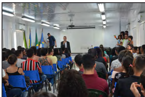
Aula Inaugural do semestre 2018.2

Em cada semestre de 2018, o Campus Ipojuca ofertou 180 vagas em cursos técnicos (Automação Industrial, Construção Naval, Petroquímica, Química e Segurança do Trabalho) e de graduação (Licenciatura em Química) – um total de 360 novas vagas no ano.