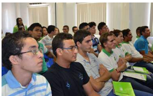
Palestras do Seminário Naval, no miniauditório do Campus

Organizada pela coordenação de Construção Naval, com apoio da direção do Campus e recursos do CNPq, a segunda edição do evento surgiu da interação entre o IFPE-Campus