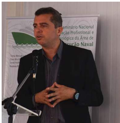
Prof. Enio Camilo de Lima

No ano de 2015, o Campus Ipojuca completou seis anos de funcionamento em nossa estrutura permanente. Somos um Campus jovem, que venceu etapas importantes e tem grande potencial de disseminar saberes e produzir conhecimento no litoral sul pernambucano.