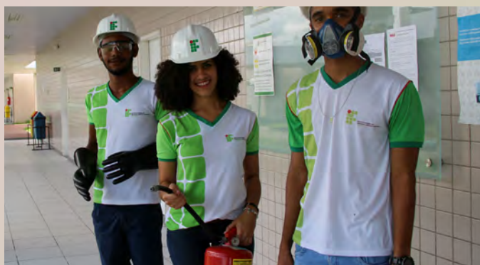
SEGURANÇA DO TRABALHO