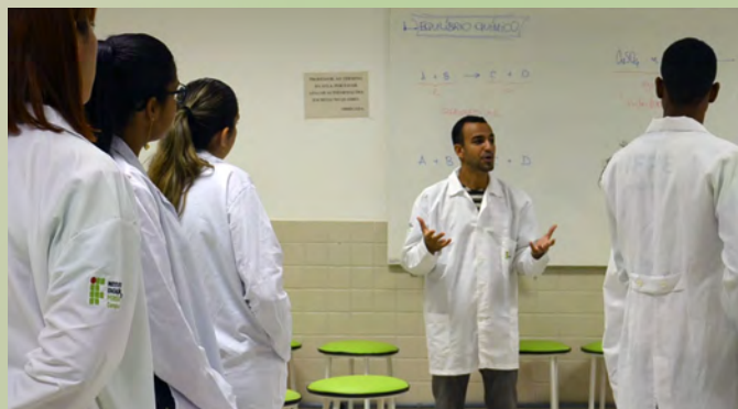
LICENCIATURA EM QUÍMICA