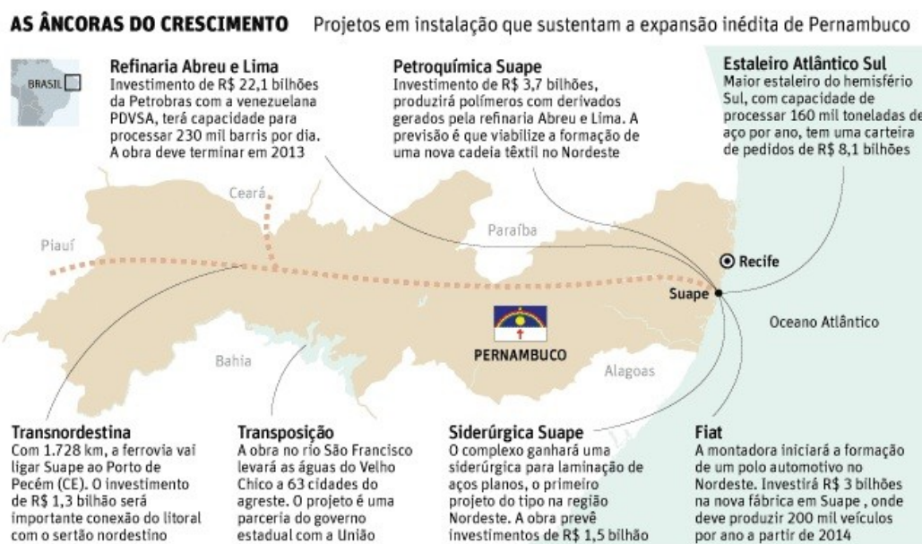
Figura 1 – Âncoras do crescimento de Pernambuco.

Com o aumento da renda per capita, do nível de escolaridade, além dos grandes investimentos nos setores públicos e privados, Pernambuco vem liderando o ritmo de crescimento dos estados nordestinos, deixando ainda mais evidente o grande mar de oportunidades que toda a região oferece ao Brasil. Este desenvolvimento não está focado em apenas uma região do estado, conforme mostra a Figura 1.