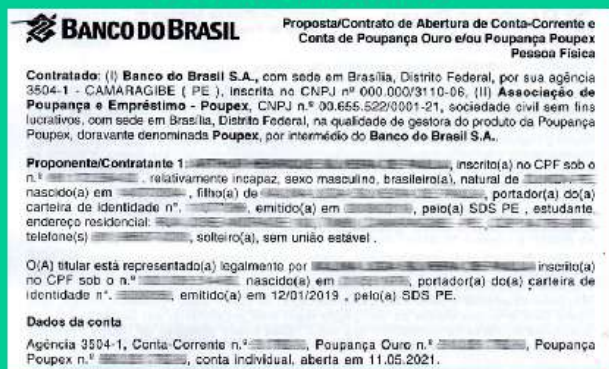
CONTRATO DO BANCO